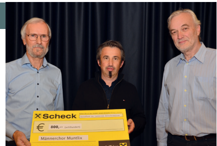
Spendenübergabe Männerchor Muntlix